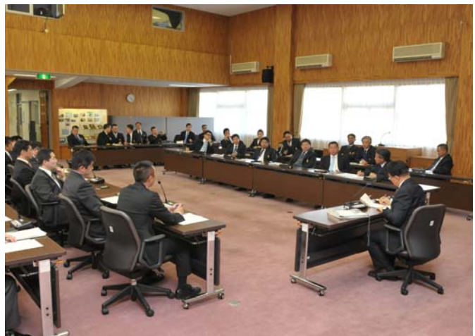
タイ国防大学研修団との意見交換

また、21日にはタイ国防大学研修団が来訪し、タイ側研修員及び一般課程研修員が3グループに分かれ、両国で提示したテーマを中心にフリーディスカッション形式による活発な意見交換を実施しました。