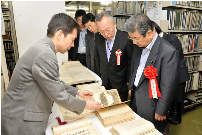
(右から)北澤防衛大臣、金澤大臣官房長、徳地人事教育局長、(左)柴田史料室長

6月24日、一般課程修了式後、北澤防衛大臣が防衛研究所史料室にて、明治三陸地震、昭和三陸地震、関東大震災といった震災関連史料を中心に、旧日本陸海軍関係史料の保有・公開状況を視察しました。